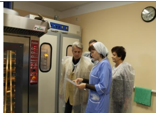
Автодорожная ул., 2Б, село Русский Камешкир