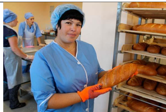
Пекарня ИП Алюшин- Автодорожная ул., 2Б, село Русский Камешкир