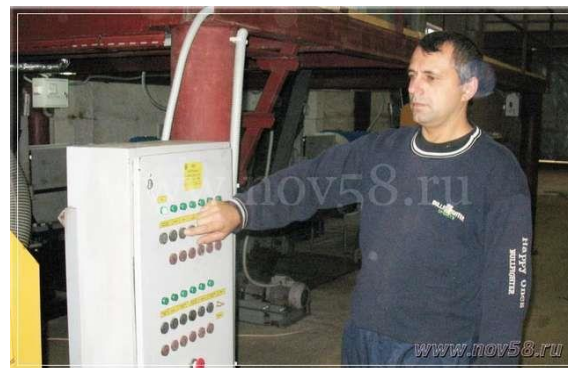
Цех отжима растительного масла