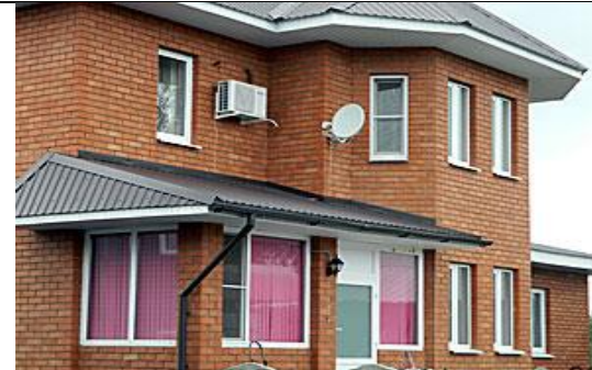
«Унты от Зуева»