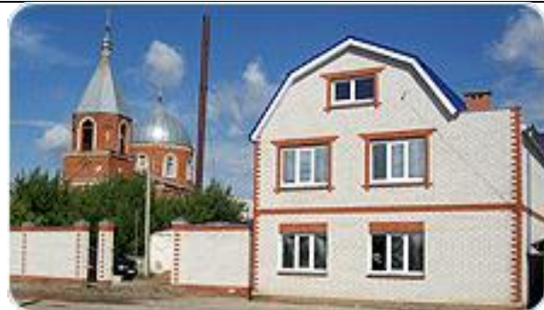
«Унты от Ивановича»