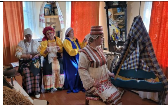
Краеведческий музей Камешкирского района