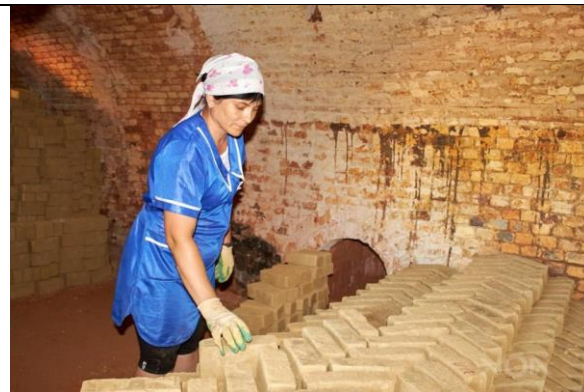
ООО «АВР» (Камешкирский кирпичный завод)