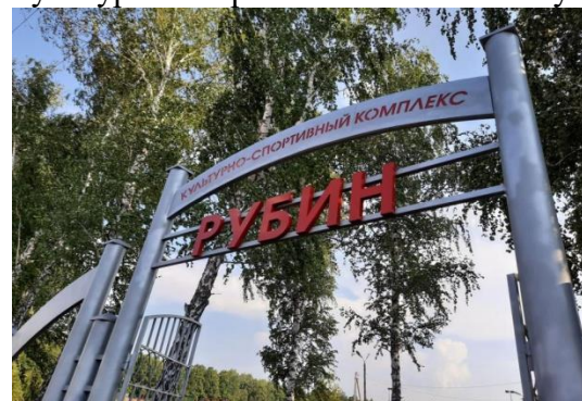
культурно-спортивный комплекс «Рубин»