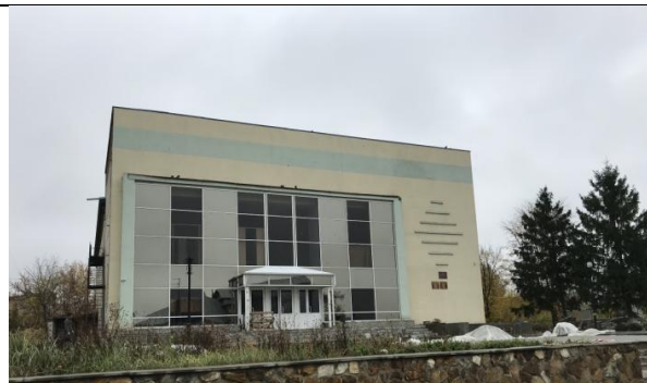
Районный дом культуры (РДК)