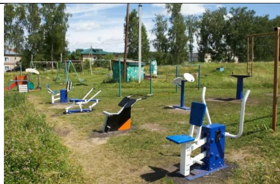
культурно-спортивный комплекс «Рубин»